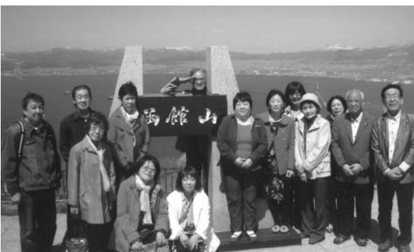
みんなでロープウェイに乗り函館山へ ～地元にいながら函館山にきたのは何十年ぶりという方もいて、晴天の中ホントに気持ちよくて元気にになりました!～