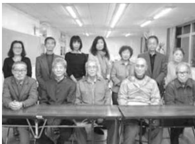
平成30年度 総会にて

当会の目的や活動に興味のある方は、ぜひ一度気軽な気持ちで「月例研修会」に参加していただきたいと思えます。会員の募集は随時しておりますので、事務局までご連絡ください。会員の年会費は3000円ですが、まずはどの様なものなのか体験してください。