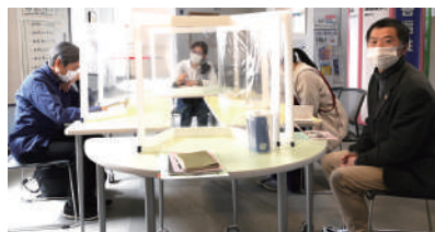
2021年5月15日初開催。 感染症対策を講じながら開催しました。 次回の告知はブログ・SNS等で発信します。 ※お茶の提供は行っていません

市民と移住者の集い『まちセン茶 サ 論 ロン 』が平日開催のため、参加できない…という方に向けて土曜日に『まちセンカフェ』を企画・開催しました。 今後も参加されたみなさまからの要望をお聞きしながら、『交流の場』を生み出してまいります。