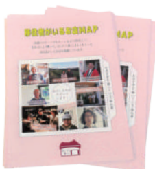
掲載店一覧、 MAPのダウンロードはこちら▶

お店の方から体験談やアドバイス等を聞くことで、移住を希望するみなさんの疑問や不安が和らぎ、函館・道南に移住してみよう!というきっかけになれば幸いです。函館に移住してお店をはじめたいという方もMAPをご活用ください。