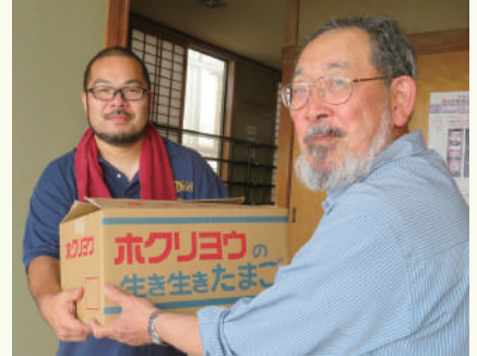
お米、野菜、乾麺、缶詰、レトルト食品等の提供を受け付けています。新聞等の報道により私たちの活動が広く知られ、支援の輪が広がっています。HPもどうぞご覧ください。

新型コロナウイルスの影響で支援を必要とする方が増えています。配布する食料はまだ不足しており、より多くの方からの支援が必要です。寄付も随時受け付けています。今後はこの仕組みを函館・道南に定着させ、食を通じて人の縁を結び、お互いが助け合う「困ったときはお互いさま」な社会づくりを目指してまいります。