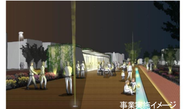
事業実施イメージ