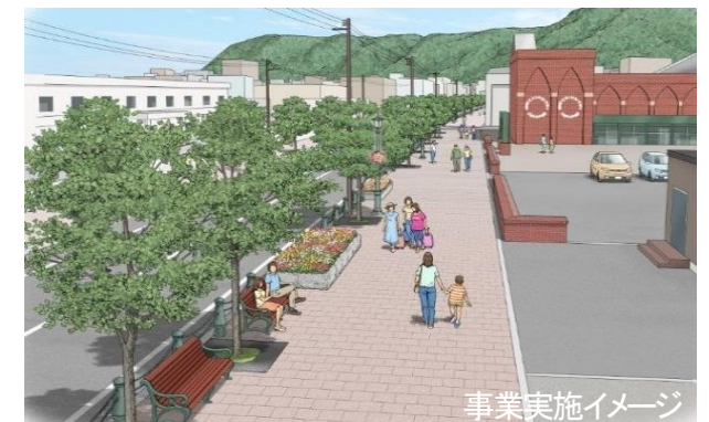
事業実施イメージ