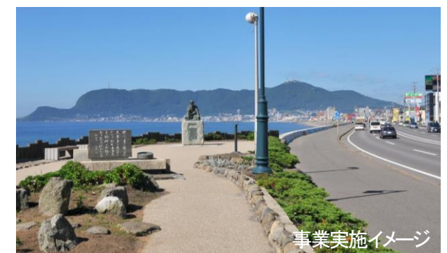
事業実施イメージ